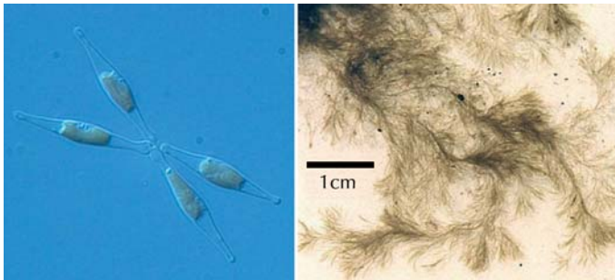
Abb. 16: Im Blickpunkt der Genomforscher – Die Diatomee Phaeodactylum tricornutum (links) und die Braunalge Ectocarpus siliculosus (rechts).

links) ist weltweit verbreitet und spielt auch eine bei der kommerziellen Nutzung von Diatomeen wichtige Rolle, zum Beispiel bei der Herstellung von Fettsäuren. Das Alfred-Wegener-Institut ist einer von neun europäischen Partnern eines Genomprojektes für die Braunalge Ectocarpus siliculosus (Abb. 16, rechts), das derzeit in Frankreich durchgeführt wird. Braunalgen haben bei der Strukturierung von Ökosystemen an Küsten eine wichtige Funktion, speziell an Felsküsten oder Küsten mit ausgeprägten Gezeiten von den tropischen bis zu den polaren Gebieten. Weitere Genomprojekte mit Beteiligung des Alfred-Wegener-Instituts sehen die Sequenzierung eines Meereisbakteriums und einer roten Makroalge vor.