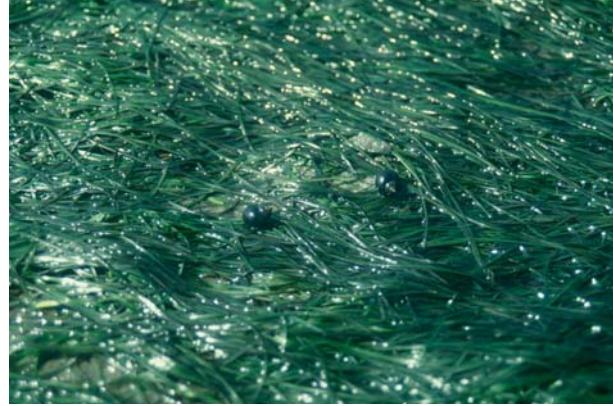
Abb. 10: Seegraswiesen (rechts: eine Detailaufnahme mit zwei Strandschnecken) sind geeignete Qualitätsindikatoren für den Zustand und die Stabilität des Wattenmeeres, weil sie empfindlich auf Umweltänderungen reagieren. Seegraswiesen sind ein wichtiger Lebensraum für Jungfische und Wirbellose. Während der 1950er und 1960er Jahre verschwanden die meisten Seegraswiesen aus dem Gezeitenbereich des südlichen Wattenmeeres. Im nördlichen Wattenmeer fand keine vergleichbare Abnahme statt. Im letzten Jahrzehnt nahmen die mit Seegras bedeckten Flächen stetig zu.

Fig. 10: Seagrass beds (right panel: close up with two periwinkles) are a suitable quality indicator for the health and stability of the Wadden Sea ecosystem, as they respond very sensitively to changes in their environment. Seagrass beds represent an important marine habitat and serve as a feeding and nursery habitat for juvenile fishes and invertebrates. During the 1950's and 1960's most intertidal seagrass beds in the Southern Wadden Sea vanished and are now slowly recovering. In the Northern Wadden Sea no comparable decline was observed. During the past decade, the area covered with seagrass increased continuously.