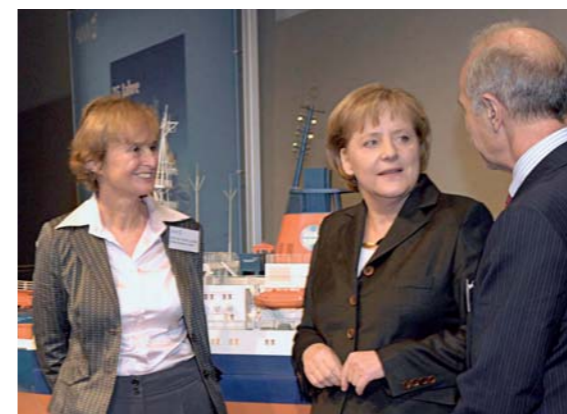
Abb. 3: Am 28. November 2007 nahm Bundeskanzlerin Dr. Angela Merkel an der Festveranstaltung zum 25. Jahrestag der Indienstellung von FS ‚Polarstern‘ im Berliner Naturkundemuseum teil.