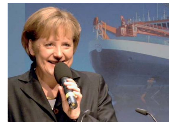
Abb. 4: Bundeskanzlerin Dr. Angela Merkel während ihrer Festrede am 28. November 2007 in Berlin