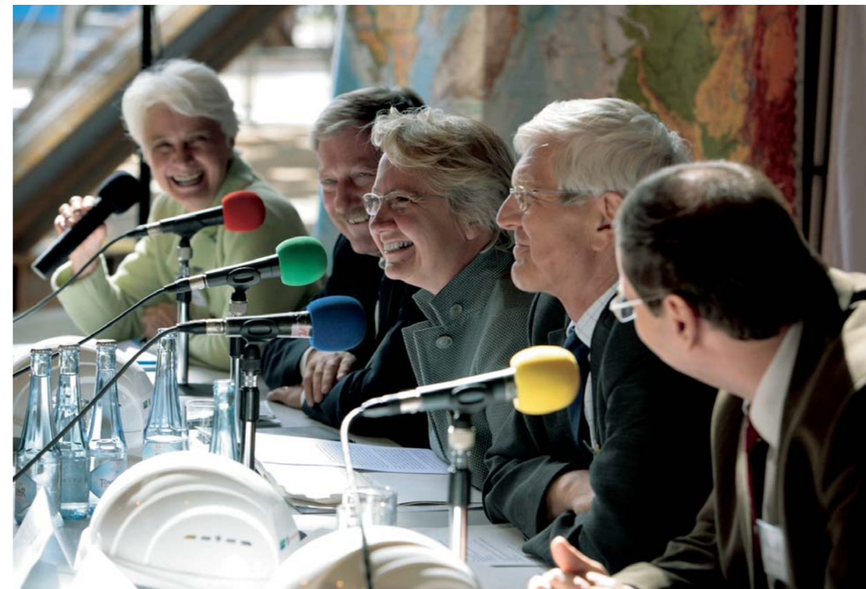
Abb. 1: Das Podium der Pressekonferenz zur Vorstellung des Neubaus der Neumayer-Station III mit Bundesforschungsministerin Frau Dr. Annette Schavan am 3. September 2007 in Bremerhaven

From 2006 to 2007, the Alfred Wegener Institute published a total of 94 press releases in German, and 45 in English. Through media collaboration with projects of the International Polar Year, international media contacts in particular were developed. In February 2006, the media and public relations department organised a seminar for journalists on research topics in the Arctic in order to prepare the media for the Arctic Summit Science Week, which took place at the AWI Potsdam. Media representatives followed the event with great interest. As a result of the positive response, the AWI public relations department organised another seminar for journalists in January 2007. This second workshop focused on the International Polar Year, introducing several individual projects, as well as the overall concept of the international large-scale research endeavour, and with the purpose of strengthening media interest. Again, the seminar was well attended. A total of 30 media representatives, predominantly from chief editorial offices and the lead media, participated in the event.